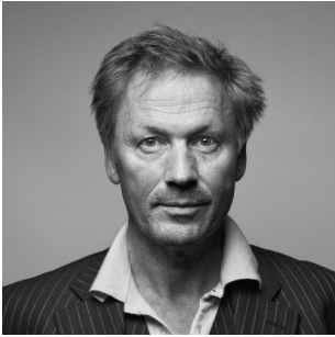
1981 MATTHIAS ZSCHOKKE «Max» (List-Verlag 1981) Übersetzt ins Französische (Editions Zoé 1988)