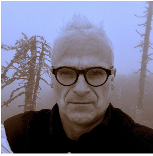
1987 WERNER FRITSCH «Cherubim» (Suhrkamp-Verlag 1987)